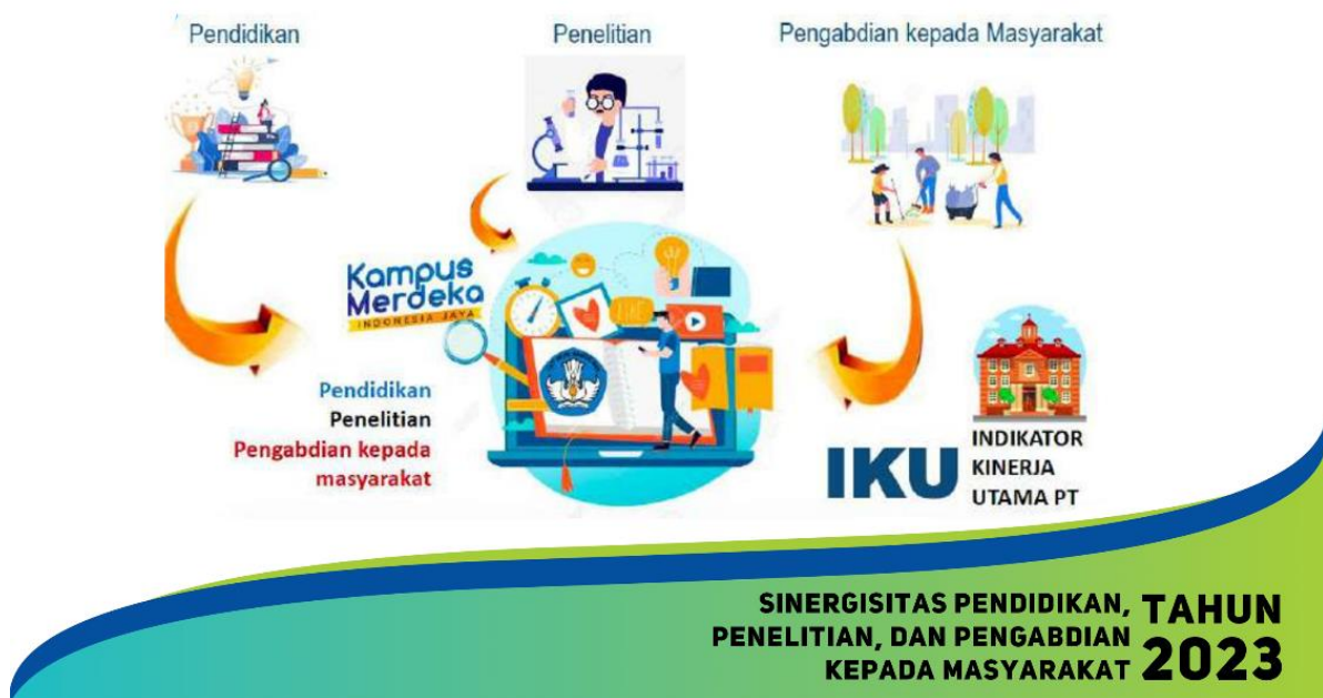
Gambar 1.2 Sinergisitas Pendidikan, Penelitian, dan Pengabdian Kepada Masyarakat

Program penelitian dapat diarahkan untuk mengembangkan riset akademik baik itu sains maupun sosial humaniora yang dilakukan di bawah koordinasi dan pengawasan dosen atau peneliti. Sedangkan program pengabdian dapat dikemas menjadi sebuah proyek pengembangan desa di kawasan pedesaan untuk membantu masyarakat dalam membangun ekonomi berbasis kerakyatan, peningkatan infrastruktur dan lain sebagainya. Integrasi dan sinergisitas antara pendidikan, penelitian, dan pengabdian kepada masyarakat diharapkan dapat menjadi sebuah garis linear yang saling menunjang sehingga luaran dari setiap program akan saling berkaitan dan saling menunjang guna meningkatkan fleksibilitas dan akuntabilitas untuk mewujudkan Indikator Kinerja Utama Perguruan Tinggi (IKU).