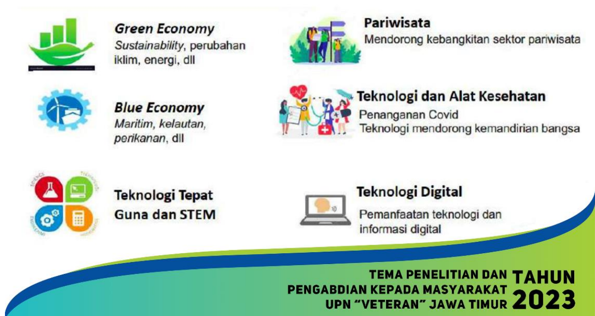
Gambar 1.1 Tema Penelitian dan Pengabdian Kepada Masyarakat Tahun 2023

Topik dan tema penelitian selain harus berpedoman pada RIRN dan Renstra Penelitian UPN Veteran Jawa Timur, juga harus mengutamakan tema green economy , blue economy , teknologi tepat guna dan stem, pariwisata, teknologi dan alat kesehatan, serta teknologi digital. Dalam era revolusi industri 4.0 yang sudah menuju 5.0, sinergisitas dan pengoptimalan keenam potensi tersebut harus semakin masif digalakkan untuk meningkatkan efisiensi dalam segala bidang kehidupan.